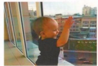
Вместе сохраним здоровье детей!

Не теряйте бдительность, объясните ребенку, что опираться на окна нельзя, а тем более высовываться наружу.